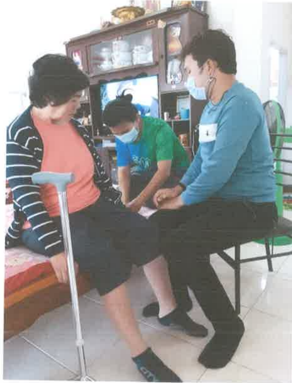
ภาพกิจกรรมการดูแลผู้ที่มีภาวะพึ่งพิง ตำบลเมืองเพีย